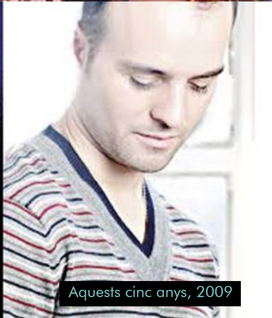
Aquests cinc anys, 2009