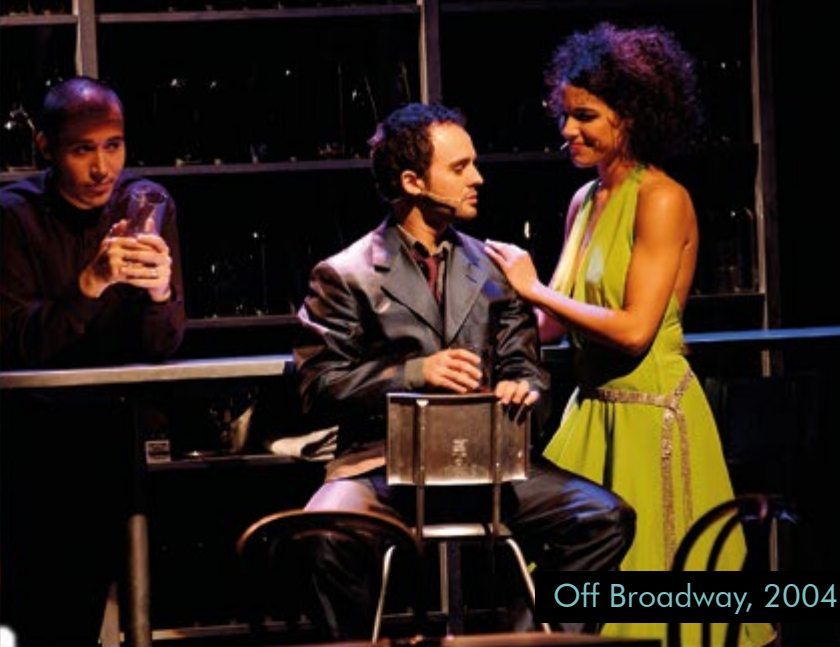
Off Broadway, 2004