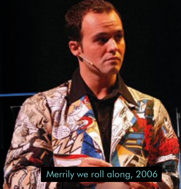
Merrily we roll along, 2006