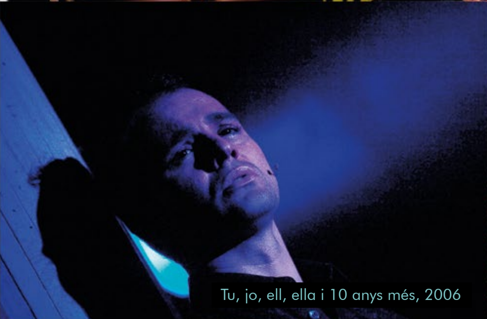
Tu, jo, ell, ella i 10 anys més, 2006