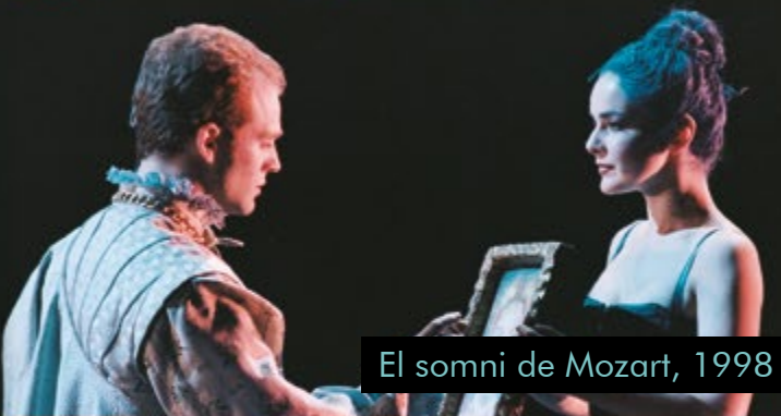
El somni de Mozart, 1998