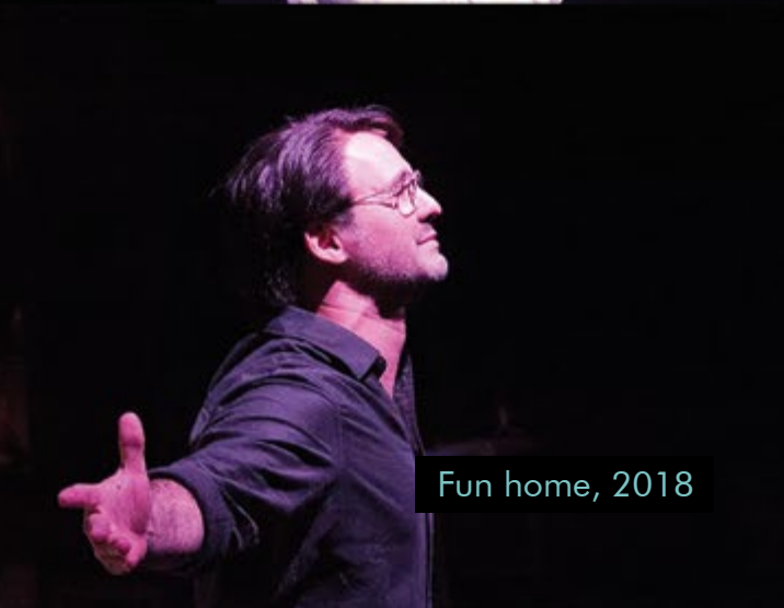
Fun home, 2018