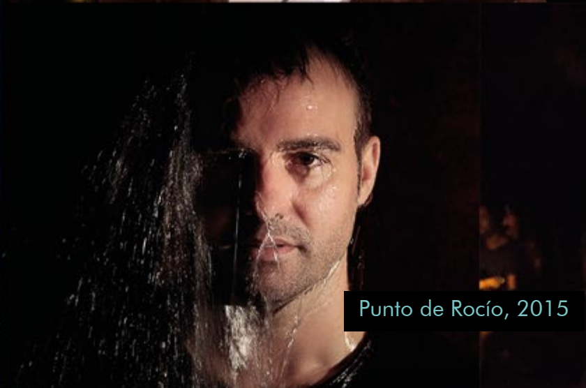
Punto de Rocío, 2015