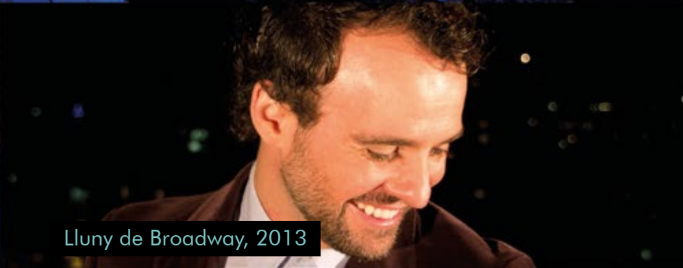
Lluny de Broadway, 2013