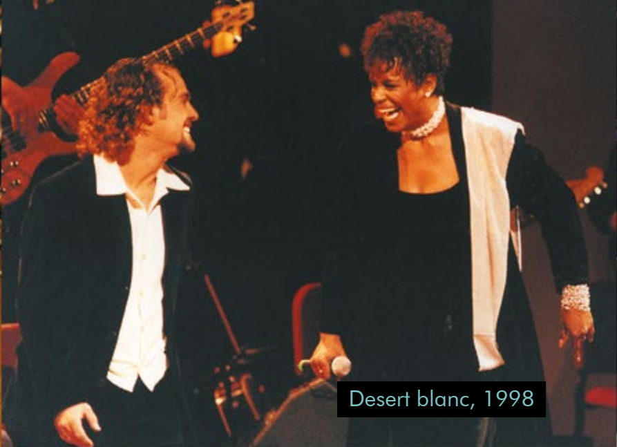
Desert blanc, 1998