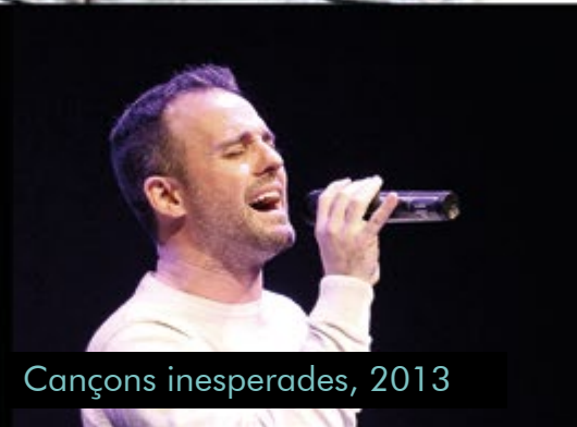
Cançons inesperades, 2013