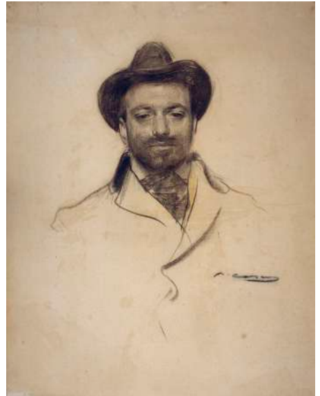
Retrat de Josep Maria Sert, per Ramon Casas (cap al 1904).

Al llarg de la seva carrera, va pintar murals en salons privats i públics arreu d'Espanya, França, Anglaterra i els